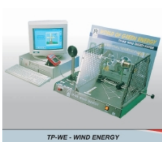
&nbsp; Вятърна енергия