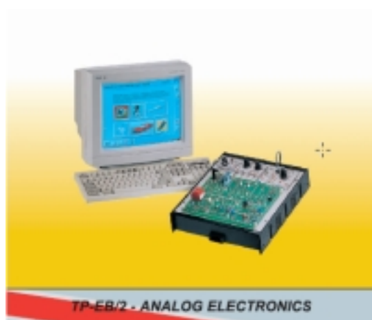
&nbsp; Основи на електрониката. Цифрова електроника