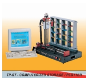
TP-ST - COMPUTERIZED STORAGE / PLOTTER