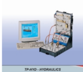
TP-HYD - HYDRAULICS

Системата е изградена от следните модули: