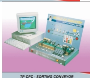
TP-CPC - SORTING CONVEYOR