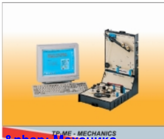
TP-ME - MECHANICS &nbsp; Механика