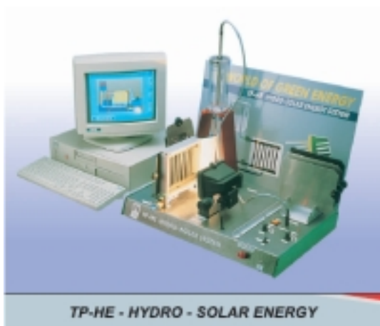
&nbsp; Водно-слънчева енергия