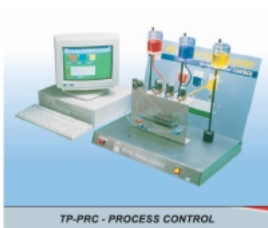
&nbsp; Управление на процеси