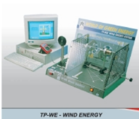
&nbsp; Вятърна енергия