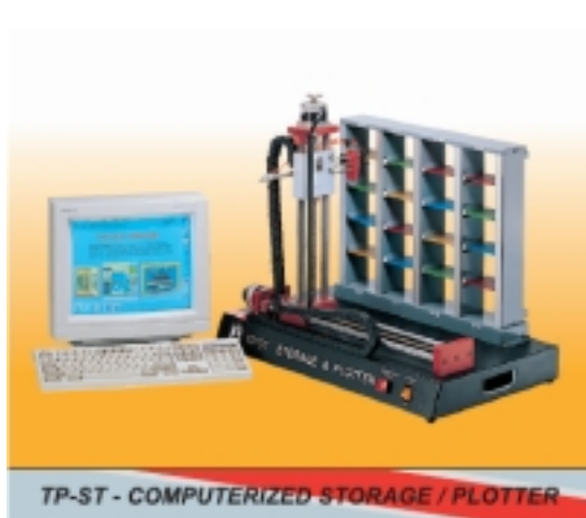
&nbsp; Компютризиран склад/плотер