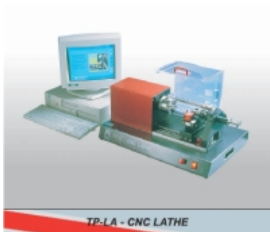
&nbsp; Цифров струг