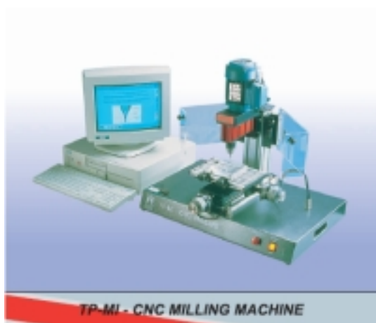
&nbsp; Цифрова фреза