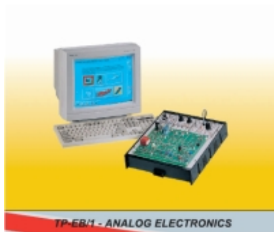
&nbsp; Основи на електрониката. Аналогова електроника