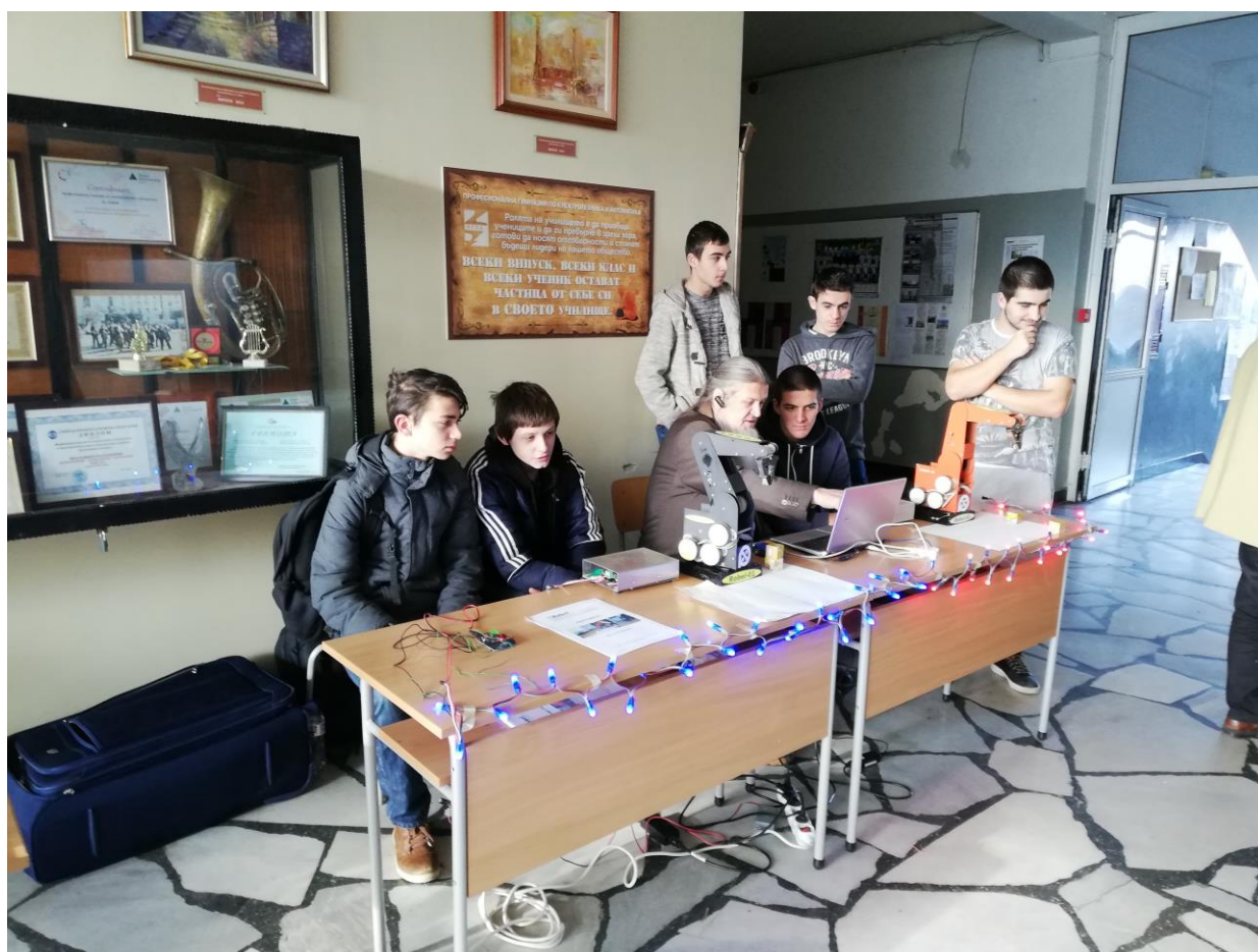
Щандът на РОБЕЛ - Съвременни образователни технологии ЕООД - гост на празника