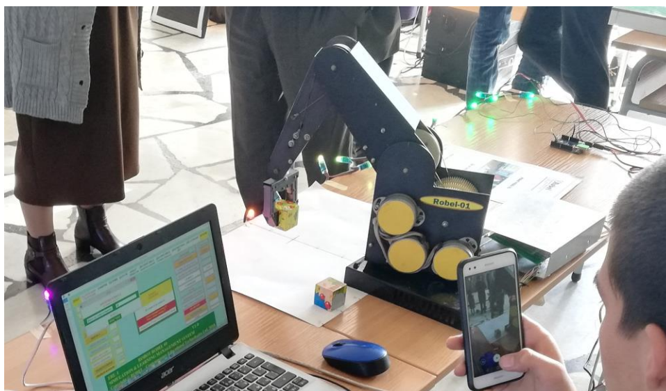
Документиране на добре програмираната задача

Щандът на РОБЕЛ - Съвременни образователни технологии ЕООД демонстрира и една съвсем нова технология за управление на пълноцветни светодиоди WS2812, управлявани от контролер Ардуино по двужична магистрала. Тази технология позволява изграждането на цветни екрани с голям формат.