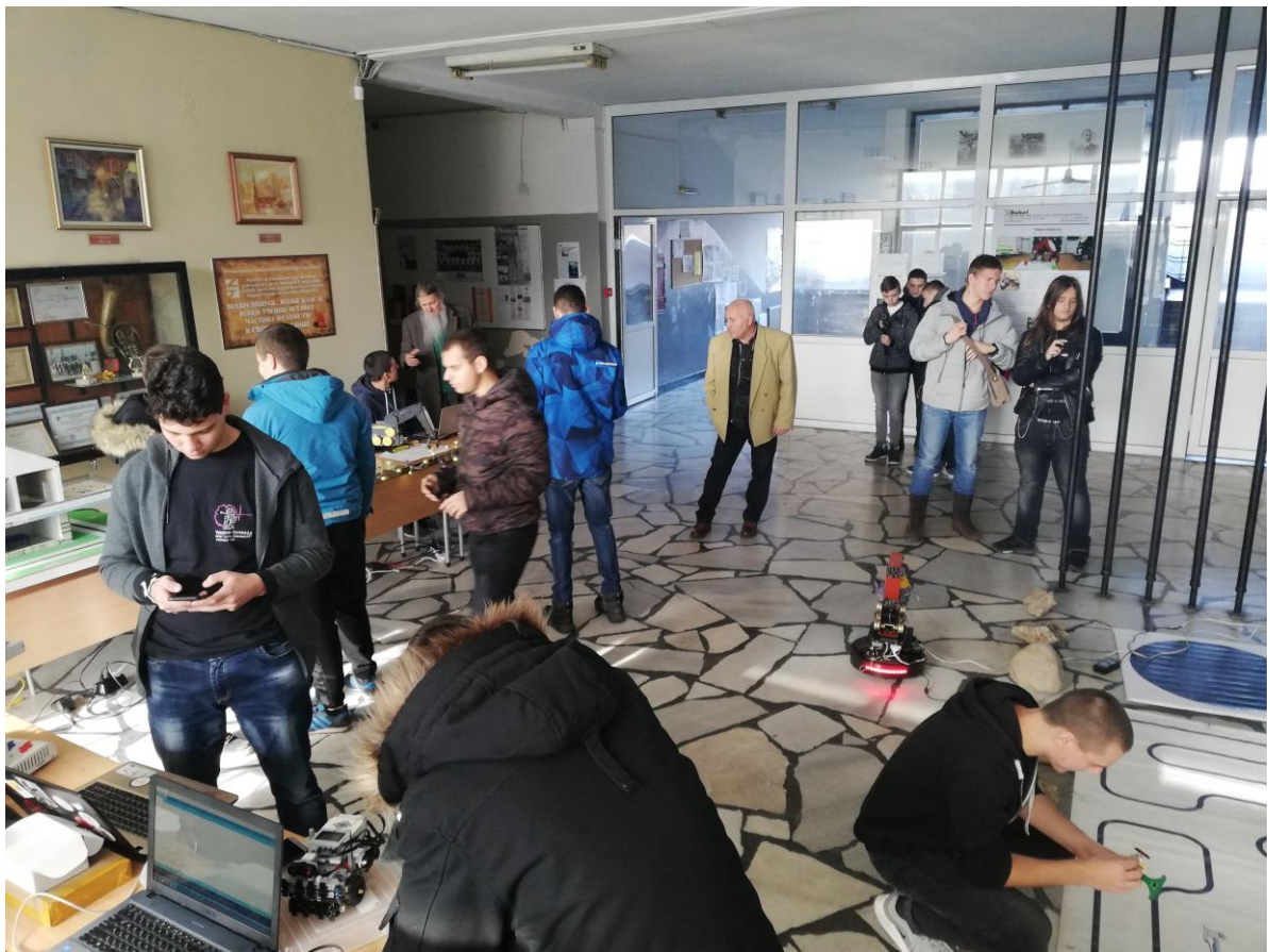
Общ изглед на изложбата

Във фоайето на първия етаж на ПГЕА беше организирана изложба на високотехнологични разработки: умна къща, 3D принтер, дрон, мобилни роботи с различни профили, и др. Домакините представиха една версия на управление на робота РОБКО-01, монтиран върху мобилна платформа.