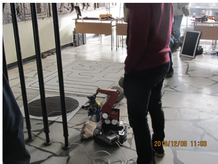
РОБКО-01 върху мобилна платформа - разработка на ученици от професионалната гимназия